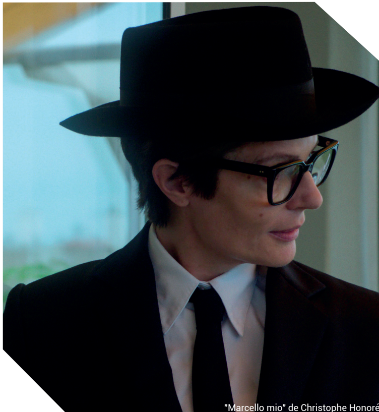
"Marcello mio" de Christophe Honoré