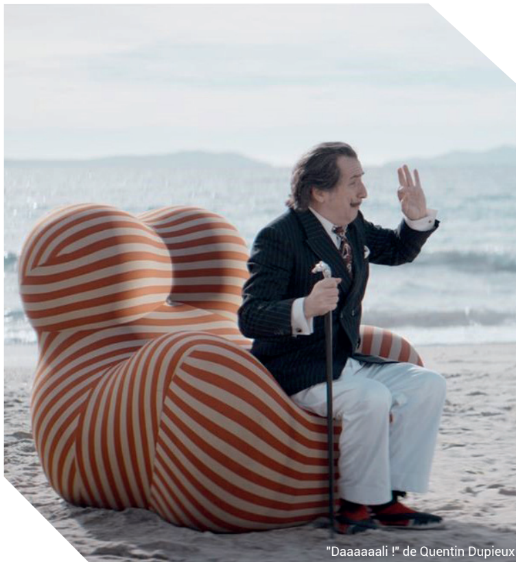
"Daaaaaali !" de Quentin Dupieux