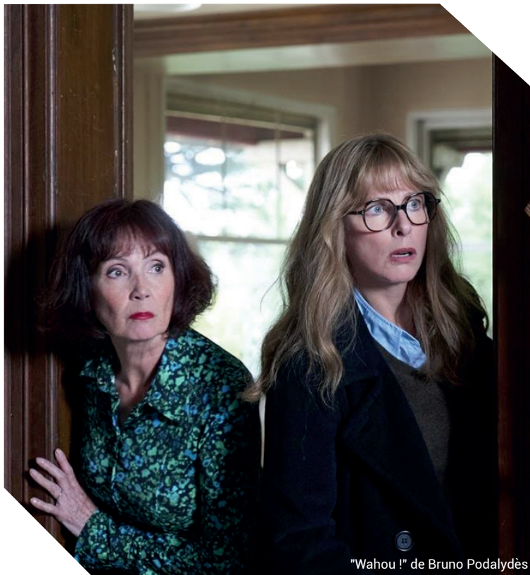
"Wahou !" de Bruno Podalydès