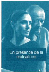
En présence de la réalisatrice