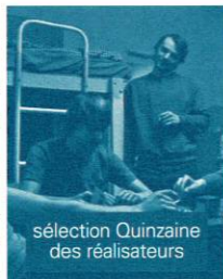
sélection Quinzaine des réalisateurs