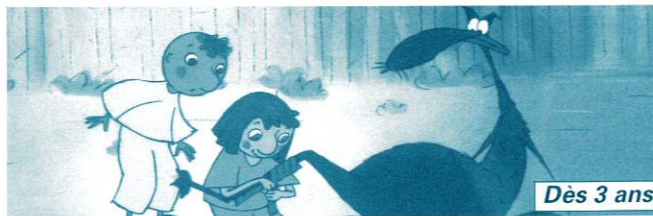
Dès 3 ans