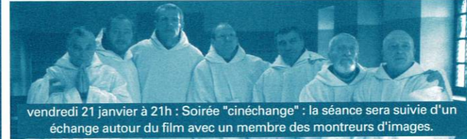
vendredi 21 janvier à 21h : Soirée "cinééchange" : la séance sera suivie d'un échange autour du film avec un membre des montreurs d'images.