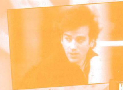
Le fils d'Élias