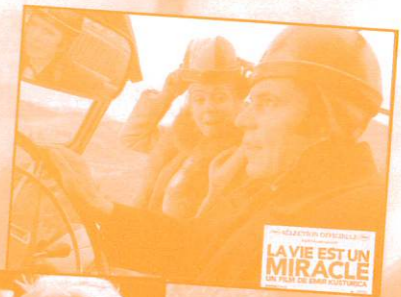
LA VIE EST UN MIRACLE