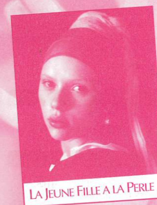
LA JEUNE FILLE À LA PERLE