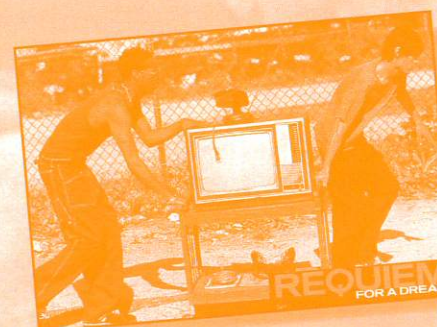
Requiem for a dream