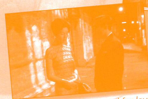
In the mood for love

Salle Ledru Rollin Centre Culturel 6, rue Ledru Rollin 47 000 AGEN 05 53 48 23 51